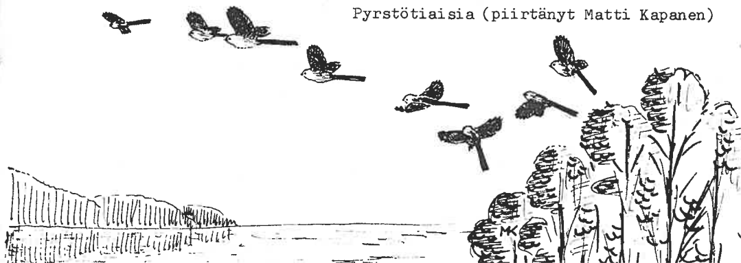
Pyrstötiaisia (piirtänyt Matti Kapanen)

Pikkukäpylintuja määritettiin vain 17.10. 2+4 Joe Höyt. kanava (HK).