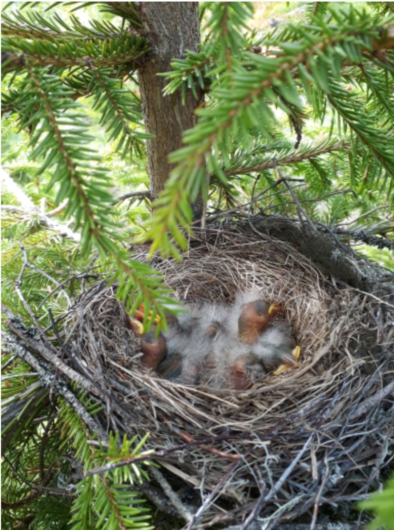
Kulorastas, pesintävarmuusindeksi 82